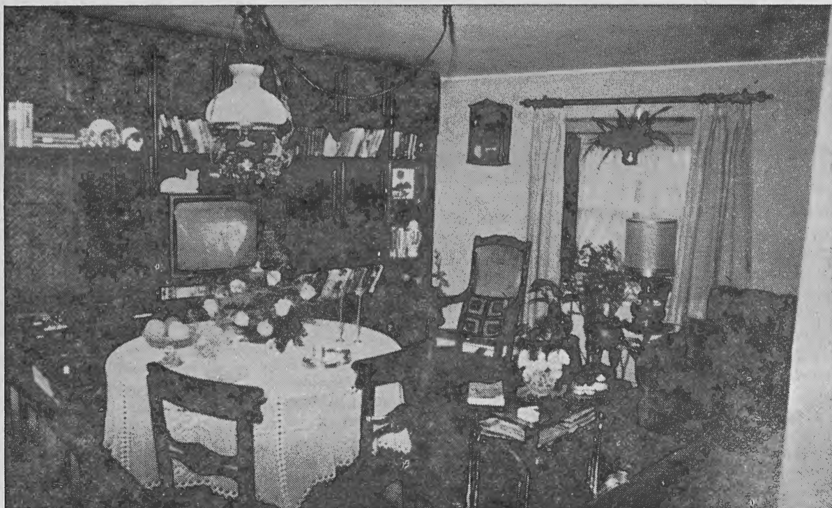
Agora, na parte recuperada pelo CRUAR, a zona ribeirinha do Porto é já habitável. «Com o sol entra a saúde, a alegria — e uma vida sã.»