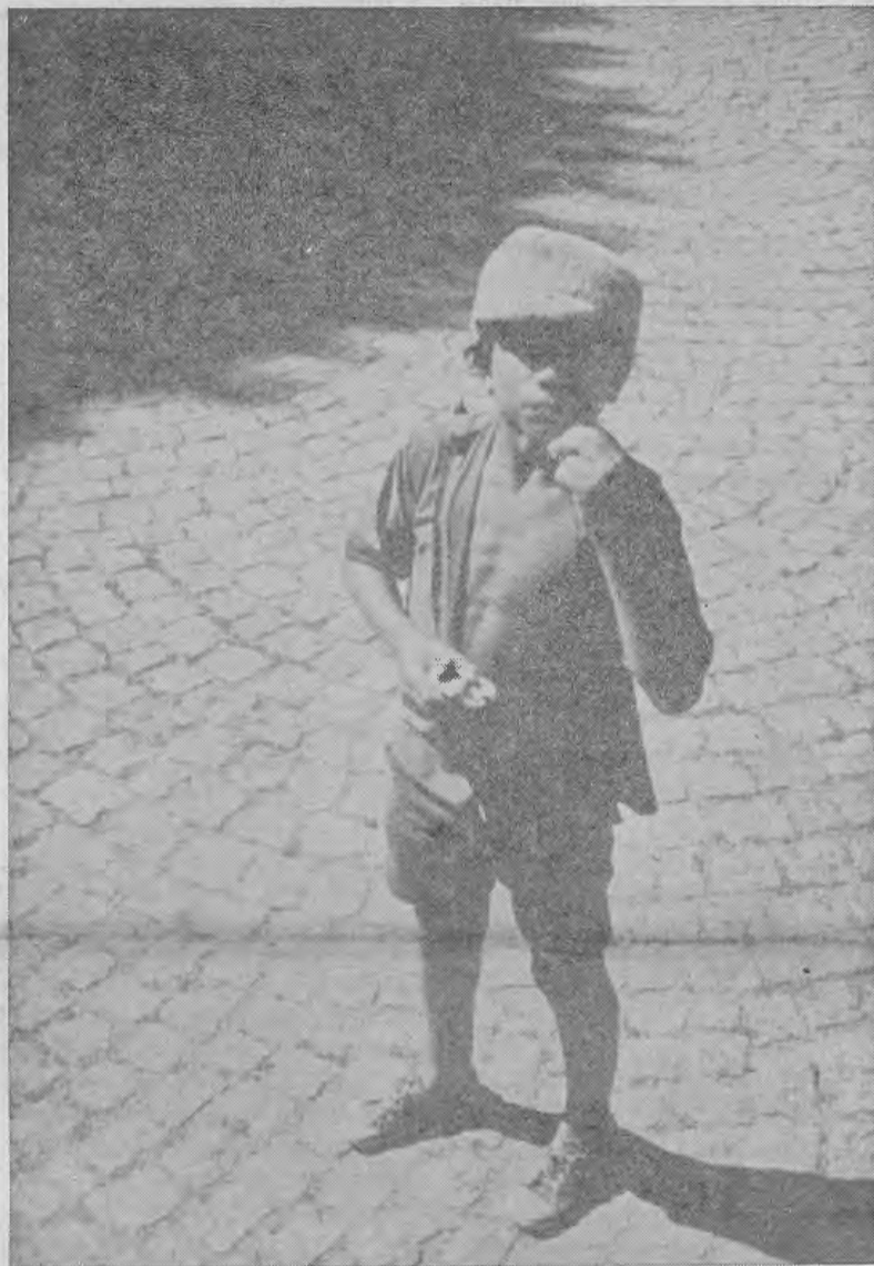
Há que vencer o «desacerto» existente entre as Instituições e os Serviços Oficiais, para que, de maneira prática e eficaz, se possam encontrar soluções adequadas aos problemas dos sem-família.

Em primeiro lugar queremos reiterar que a nossa resposta é um mal menor ante as necessidades postas. Fora da família natural, tudo o que se possa fazer, ainda que da melhor maneira, será sempre um remendo. Uma família onde mora o bom senso é o espaço adequado para a construção e desenvolvimento humanos. A natureza das coisas, quando desconhecida ou desvirtuada,